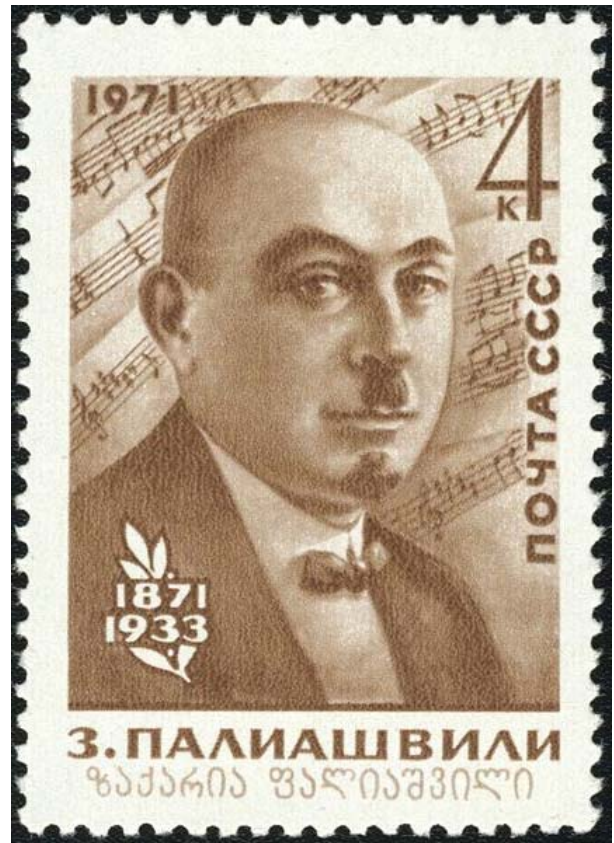
Захарий Петрович Палиашвили (1871- 1933гг.)