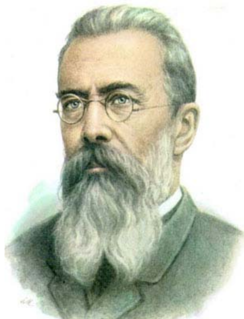
Николай Андреевич Римский-Корсаков (1844- 1908гг.)