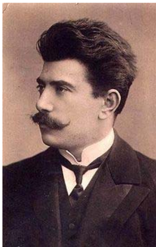
Рейнгольд Эрнест Глиэр (1875- 1956гг.)