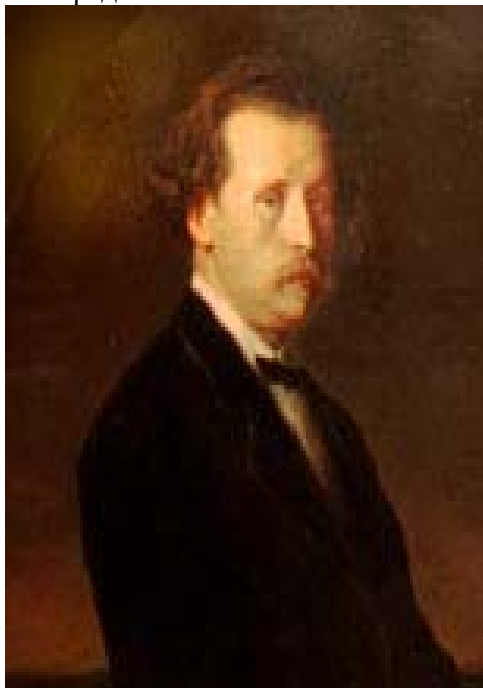
Николай Григорьевич Рубинштейн (1835-1881 гг.)

Лангер- Бетховен). Он преподавал Танееву фортепиано и элементарную теорию музыки и сольфеджио.