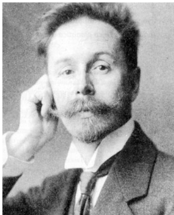
Александр Николаевич Скрябин (1871- 1915гг.)