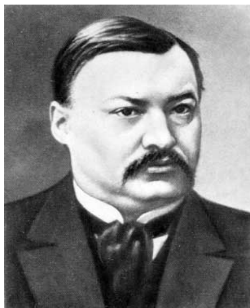
Александр Константинович Глазунов (1865- 1936гг.)

Между Глазуновым и Танеевым было немало общего, но так было не всегда. В 70-80 годы творчество петербуржцев вызывает у Танеева резкое критическое отношение. Русский стиль, выработанный «Могучей кучкой», Танеев считает не органичным, ибо он не отвечает его представлениям об истинном пути национальной музыки. Со временем отношение Танеева начинает меняться. Устанавливается контакт с Бородиным, новые сочинения Римского-