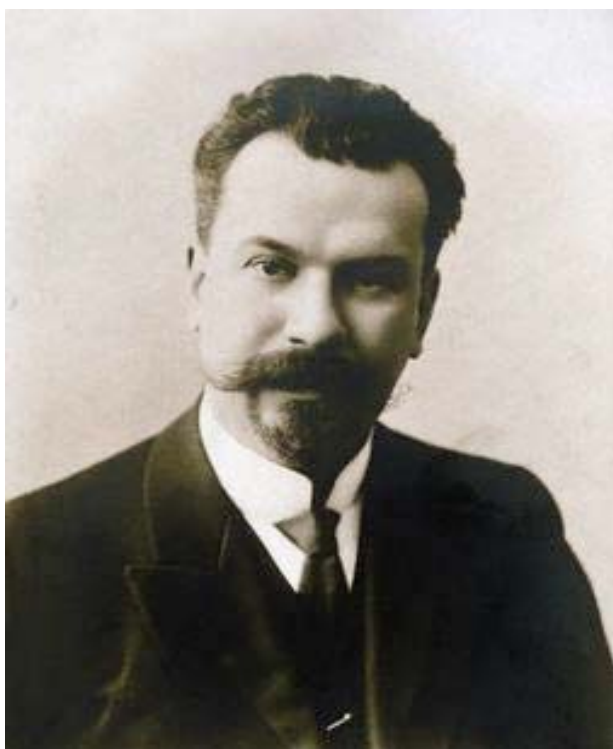
Сергей Никифорович Василенко (1872- 1956гг.)