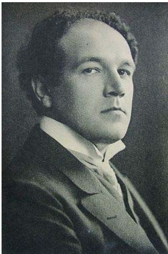
Николай Карлович Метнер (1879- 1951гг.)