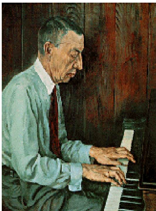
Сергей Васильевич Рахманинов (1873-1943гг.)