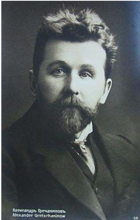
Александр Тихонович Гречанинов (1864- 1956гг.)